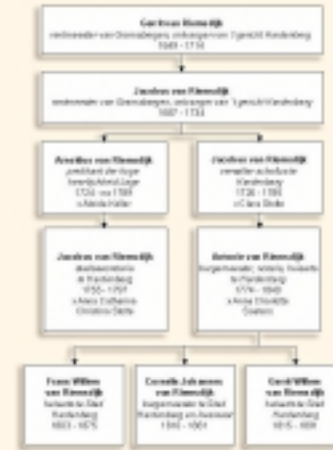
een schematisch overzicht van de voor Hardenberg belangrijkste leden van het geslacht Van Riemsdijk