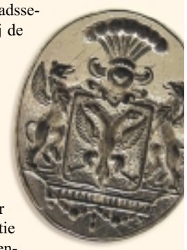
zegelring met familiewapen