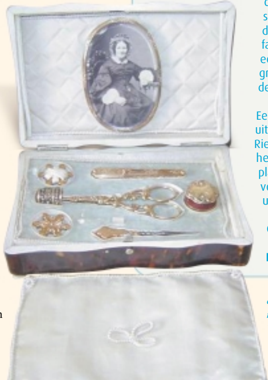
een notenhouten kistje met luxe naaigarnituur uit de collectie Van Riemsdijk

Graag tot ziens in de Oudheidkamer Hardenberg!